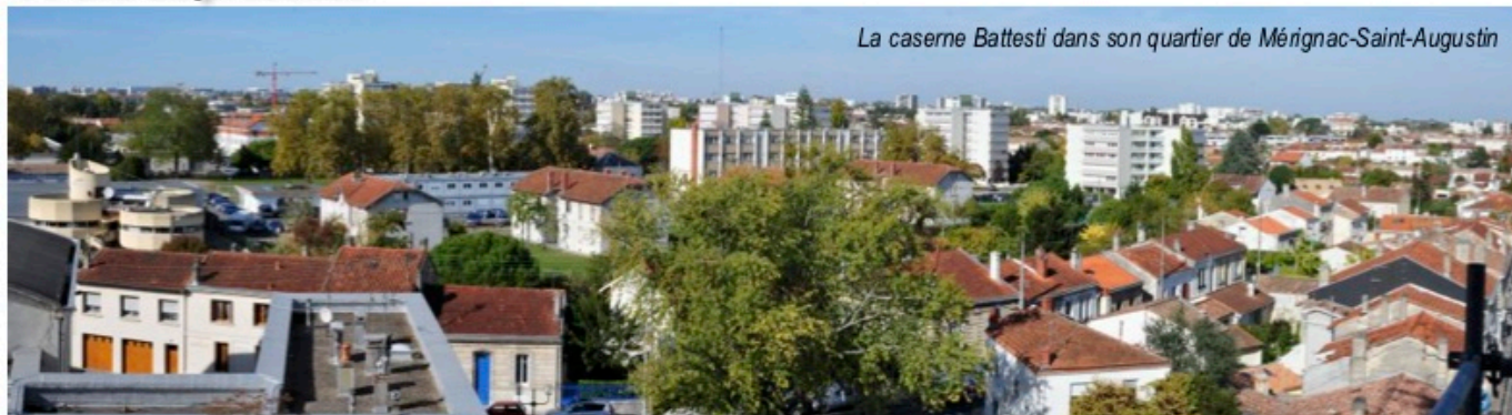
La caserne Battesti dans son quartier de Mérignac-Saint-Augustin

Qui parmi les lecteurs du Petit Augustin ne s'est jamais interrogé sur ce qu'il pouvait y avoir derrière les grilles du 59 rue Séguineau dont l'entrée fait face à l'avenue de Lognac ? Par cette entrée on devine au fond, une ancienne demeure écrasée par des immeubles plutôt modernes au milieu d'un parc arboré. La caserne Battesti a une histoire assez originale pour être racontée. C'est un lieu d'activités très important pour la gendarmerie nationale. Il faudra bien deux numéros du Petit Augustin pour faire le tour du passé historique du domaine de Lognac, de son évolution et de son impact dans le quartier Saint-Augustin.