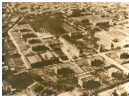
Plan général de Battesti au début du XX e siècle.

Qui parmi les lecteurs du Petit Augustin ne s'est jamais interrogé sur ce qu'il pouvait y avoir derrière les grilles du 59 rue Séguineau dont l'entrée fait face à l'avenue de Lognac ? Par cette entrée on devine au fond, une ancienne demeure écrasée par des immeubles plutôt modernes au milieu d'un parc arboré. La caserne Battesti a une histoire assez originale pour être racontée. C'est un lieu d'activités très important pour la gendarmerie nationale. Il faudra bien deux numéros du Petit Augustin pour faire le tour du passé historique du domaine de Lognac, de son évolution et de son impact dans le quartier Saint-Augustin.