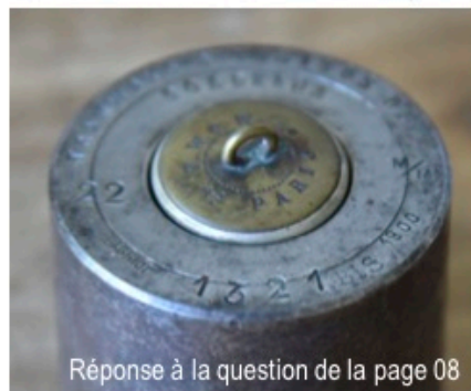
Réponse à la question de la page 08

Saurez-vous trouver à quoi servait ce cylindre dont la partie supérieure accueille une partie mobile ressemblant à un bouton ? Elle a un lien avec une entreprise très connue dans le quartier de Saint-Augustin mais sous un autre nom. 1900 gravé en haut de cette matrice vous donne à un an près la date de création de cette entreprise bien utile aux Bordelais et dont vous avez lu quelques informations dans le quizz de notre numéro 61 du Petit Augustin.