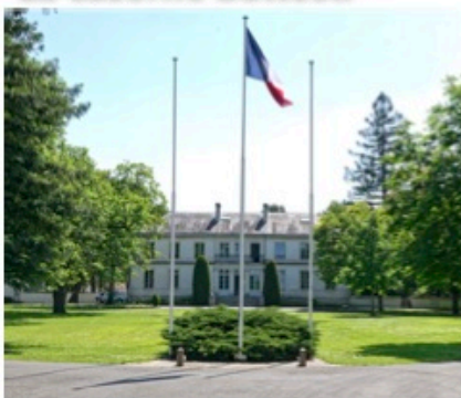
Le château de Lognac abritant l'état major de région

Elle abrite l'état-major régional de la gendarmerie nationale dans les locaux du