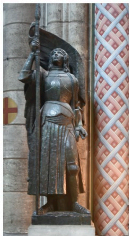
Statue de Jeanne d'Arc dans le promenoir de la cathédrale Saint-André de Bordeaux

Avec sa statue de Jeanne d'Arc, Antoine Bourdelle 1 ne pouvait avoir sa rue dans Bordeaux que sur notre petite paroisse portant le même nom à Saint-Augustin-Sud.