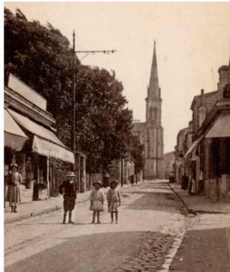
La rue Flornoy autrefois. On distingue au sol les rails du tramway de la ligne n°13. Bien avant la construction de l'église, c'était le chemin nord d'entrée du domaine du Grand Maurian. Le chemin sud arrivait au niveau de l'actuelle allée des peupliers.

L'école primaire Flornoy porte le nom de la rue par laquelle se faisait l'entrée des élèves et des enseignants autrefois. C'était le chemin nord qui amenait au domaine de Grand Maurian avant de devenir une rue aboutissant à l'église. C'est au cours de la séance du conseil municipal du 19 avril 1901 qu'a été nommé l'ancien chemin vicinal n°12, rue Flornoy. « Le docteur Marie-Jean-Baptiste Flornoy, fixé à Bordeaux depuis 1855, y est mort en 1893. Ancien chirurgien de chef de la maternité en 1872 ; professeur de l'école départementale d'accouchements ; président de la société de médecine ; l'un des fondateurs, en 1874, de la Société Protectrice de l'Enfance ; Président de cette société en 1881. »