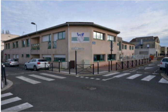
L'école primaire Sainte-Monique à l'angle des rues Franz-Schrader et Paul-Courteault avec le lycée professionnel privé Saint-Augustin à droite

À l'origine, cette école se situait à l'emplacement de l'actuelle maison de quartier des Jeunes de Saint-Augustin, allée des peupliers.