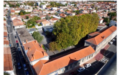
Vue aérienne de la rue Flornoy et de son école en 2011.

Elle est dirigée par une seule directrice depuis la fusion des 2 établissements en septembre 2017. Pour les 20 classes de l'école (13 +7) 24 enseignants exercent leur métier auprès de 538 élèves, 191 en maternelle et 347 en élémentaire. L'équipe est aidée dans son travail par 15 agents en élémentaire et 13 en maternelle. Il faut aussi ajouter la présence d'un psychologue de l'éducation et de 4 accompagnants d'élèves en situation de handicap (AESH)