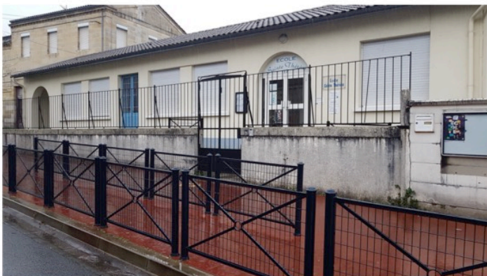
L'école primaire Sainte-Thérèse dans la rue du fils

La congrégation des sœurs de la Charité de la Sainte-Agonie a fusionné avec celle des minimes du Saint Cœur de Marie de Rodez en 1973.