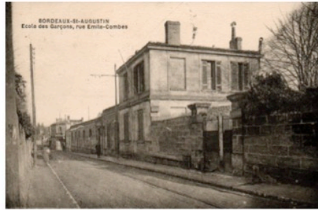
Ancienne école de garçons qui laissera la place au collège Émile-Combes en 1969

deviendra le collège Émile-Combes en 1969. Les 3 dernières classes de l'école élémentaire quitteront le collège pour un nouveau bâtiment construit le long de la rue Flornoy en 1976.