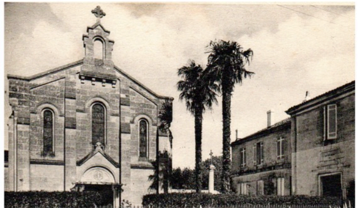
Chapelle et couvent de la Sainte-Agonie rue du fils dans le quartier du Tondu