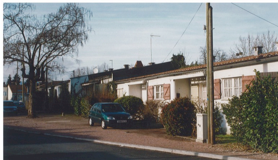
La cité « d'urgence »