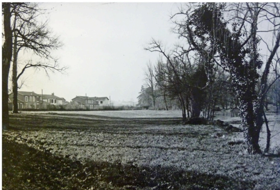
Le Peugeot à Carreire

Dans l'entre-deux-guerres, la bucolique partie sud-ouest du quartier Saint-Augustin va progressivement disparaître avec la construction des premières habitations à bon marché (HBM) un habitat décent et accessible aux petits ouvriers, employés et aux familles nombreuses. C'est en 1923-1924 que débute l'édification de la cité 1 Galliéni sous la maîtrise d'œuvre de la municipalité de Fernand Philippart, suite aux délibérations du conseil municipal du 23 janvier 1920. Cela représente 55 pavillons en rez-de-chaussée ou étage de 60 à 100 m 2 avec l'eau courante, le chauffage central 2 et sanitaires. À l'arrière de la maison, se trouve un petit jardin nourricier ou dans un angle on a placé un lavoir en ciment pour faire sa lessive, lavoir qui avec l'invention de la machine à laver a été reconverti en jardinière.